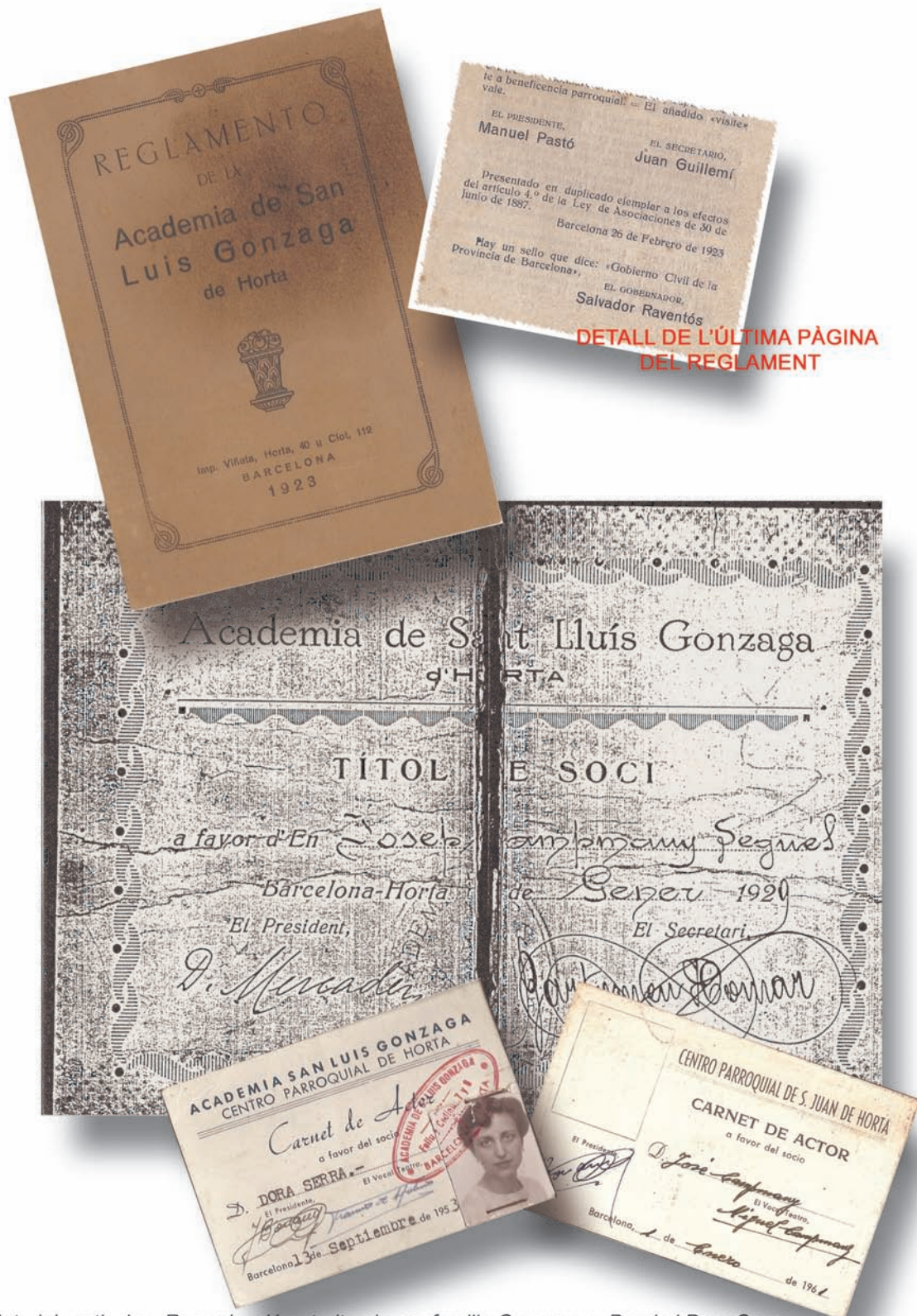
DETALL DE L'ÚLTIMA PÀGINA DEL REGLAMENT