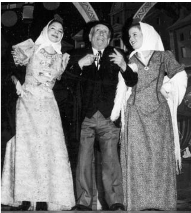
Una escena de La Verbena de la Paloma