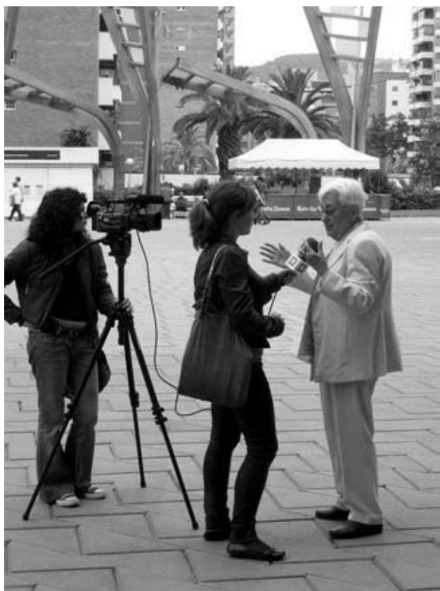
BTV, Televisió de Barcelona, entrevista l'autora del llibre

A la sala d'actes s'hi arriba per una escala noble de marbre. Era plena. Molts antics alumnes del Grup Escolar Hermenegildo Giner de los Ríos, el nom d'origen de l'escola, avui avis i àvies que gaudiren d'aquelles escoles de pedagogia viva, activa, gratuïta, plena de dedicació, de llibertat i de tolerància, que mai més hem tornat a viure a partir del 1939. Ara, a l'escola, la burocràcia, la preocupació del professorat en qui és més que qui, qui té més mèrits, més drets, fa que l'escola sigui un espai de clients més que no d'alumnes, els quals han passat a segon terme. Ho dic amb tot l'amor de mestre que, ja jubilat, no oblidaré mai els anys passats amb ells. En tornar a néixer, de bell nou tornaria a fer de mestre a l'Escola de Magisteri.