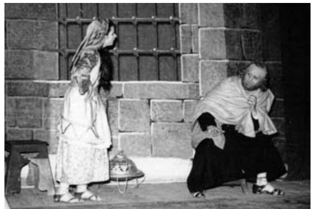
Una escena de La Passió