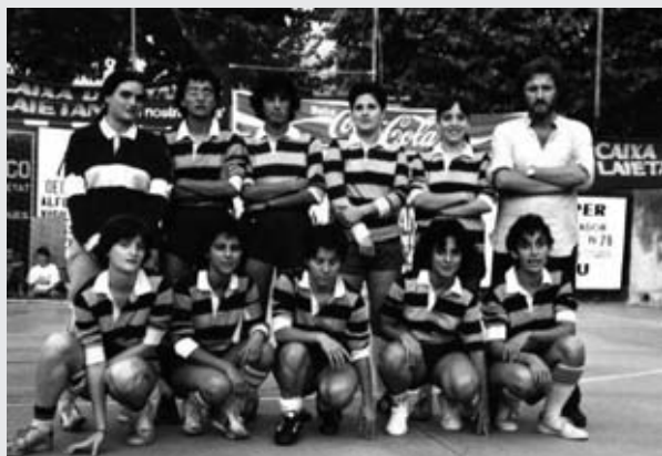
Teià: torneig internacional, 1986