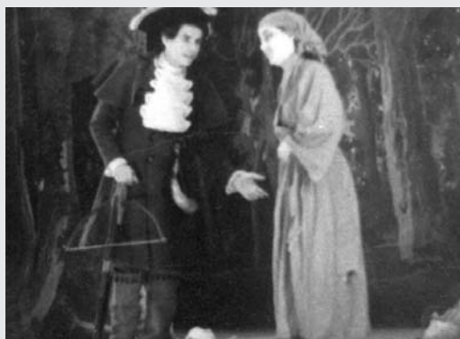
La Ventafocs (1951)