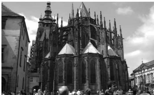
Absis de la catedral de Praga

Què us puc dir de la sortida a Praga i Budapest? Amistat, puntualitat, coses boniques a veure, bon temps, bon humor, goulach, cultura, caminades... Tot perfecte!