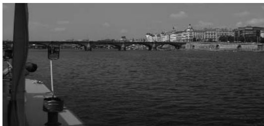
El pont Carlos, sobre el riu Moldava