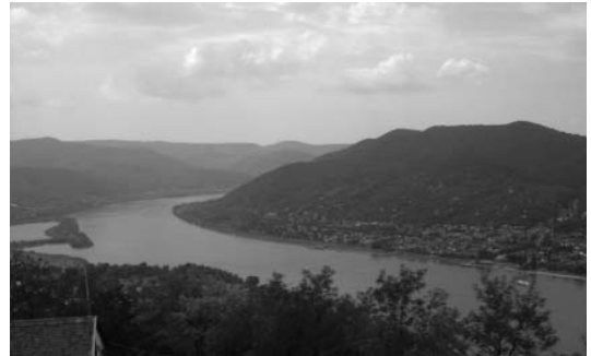
Una magnífica vista del riu Danubi

Entrarem a Hongria i ens instal·larem a BUDAPEST on sojornarem tres dies. Hongria compta amb 10.000.000 d'habitants. Moneda: florí hongarès. La conquesta magiar data de l'any 896. aquí contemplem el riu Danubi (que no és blau) el qual separa la capital BUDA de PEST. Ens ha semblat una capital molt més cosmopolita que Praga. La gent parla molts idiomes: anglès, francès, italià, castellà inclòs el català en alguna botiga. Gesticulen com els mediterranis, són molt més oberts que no els txecs. Ha estat ocupada i arrasada pels mongols, els turcs, els rumans, els alemanys i els soviètics. Fins l'any 1990, que va sortir oficialment l'últim rus de la zona. Fins aquesta data han perdut totes les guerres... i per més inri, de tant en tant, és inundada per les aigües del Danubi.