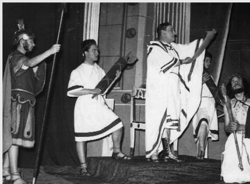
La Passió (del 1953 al 1960)