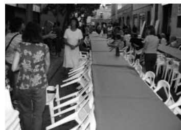
Preparació de taules per a 200 persones

Sopar de germanor i passi del Power Point de Dora Serra: "Horta 2006".