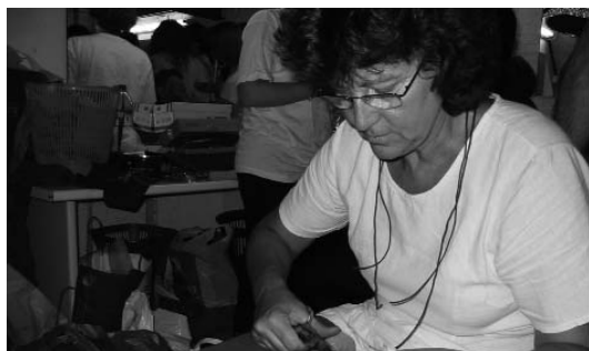
La Kati tallant i cosint vestits i sabates

També de totes les edats eren els participants damunt de l'escenari, demostrant, un cop més, la bona forma i l'òptim futur de la plantilla dels Lluïsos, més motivada i entregada que una altra que vesteix de blau i grana. A ells —els dels Lluïsos, no els altres— cal agrair-los l'esforç i la il·lusió que hi han posat. I cal estendre l'agraïment a tots els qui darrere l'escenari han fet possible l'empresa, confeccionant un vestuari enlluernador, fabricant espectaculars lianes, preparant les diverses coreografies, etc.