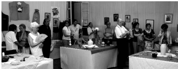
Una petita mostra de l'exposició de manualitats