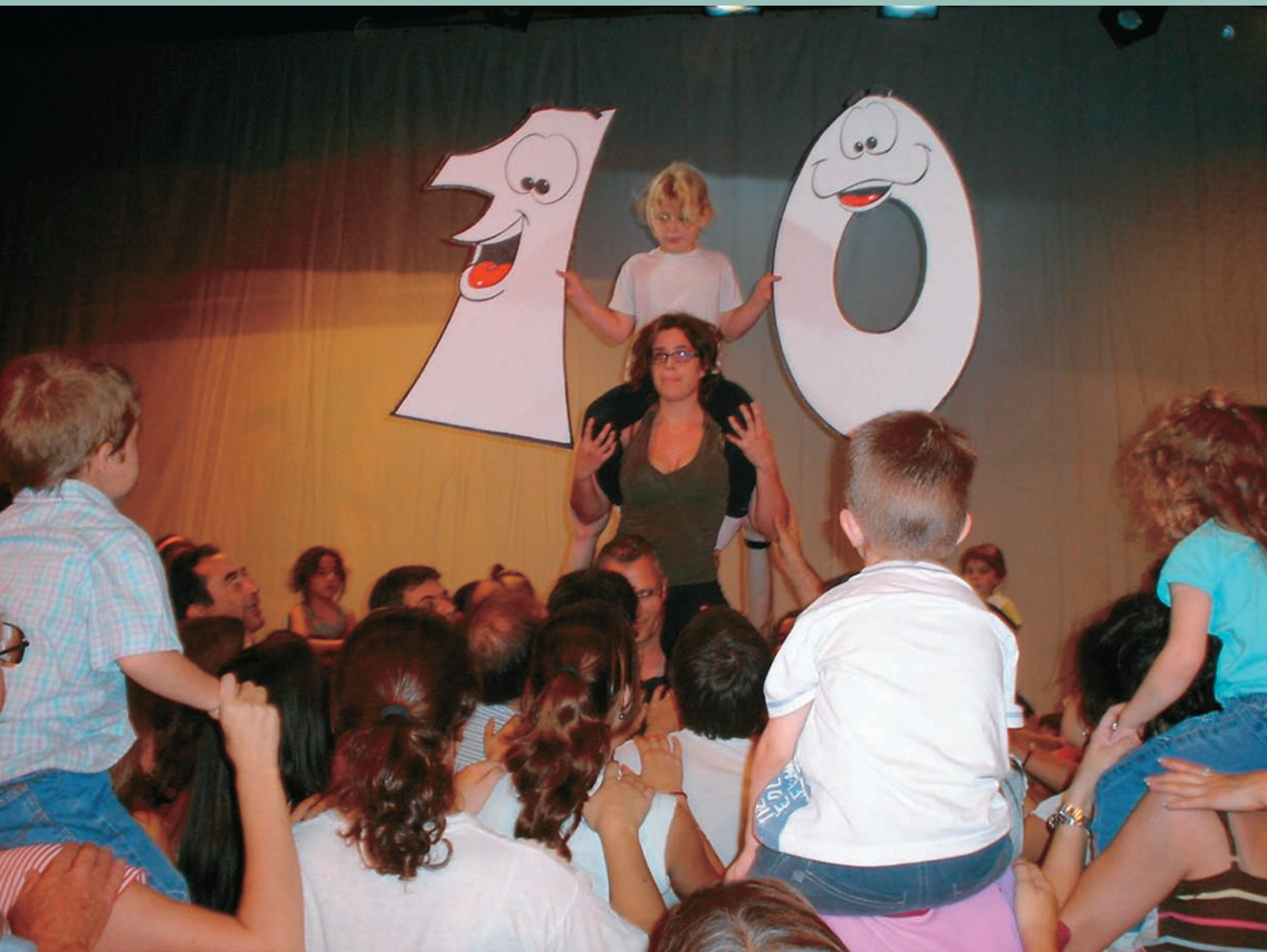
APOTEOSI DE L'ESPECTACLE "ANEM A FER UN TOMB"