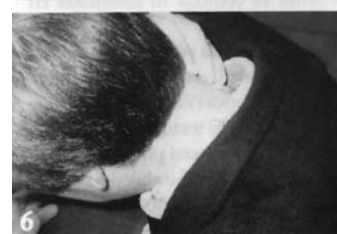
foto 6 (la posició és la mateixa de la foto 4). Seguidament es pica amb el colze a la taula i automàticament s'ensenyen les dues mans buides mostrant que ha desaparegut la moneda.

Nota: Si has tingut la precaució d'amagar una moneda duplicada en algun lloc pots fer-la aparèixer.