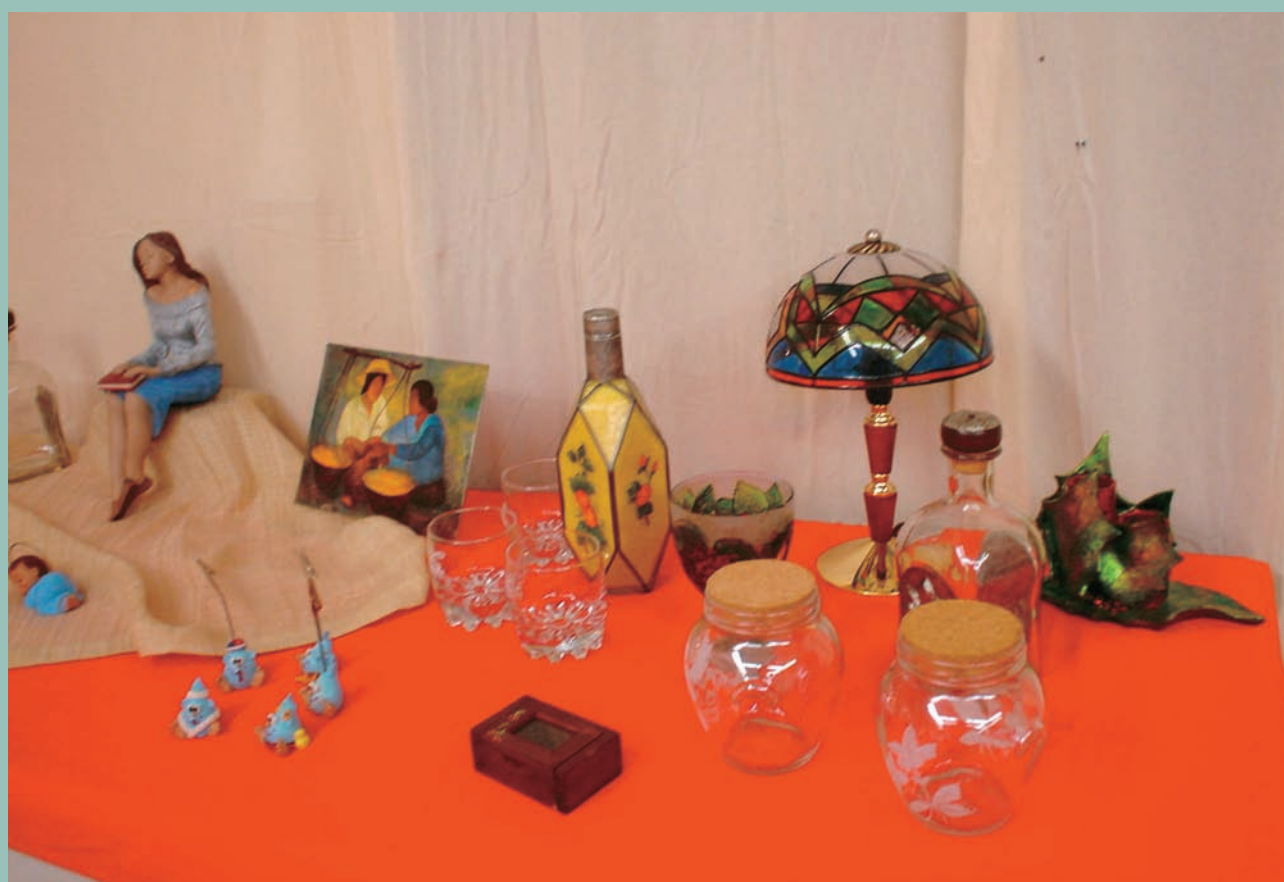
Exposició de Manualitats.