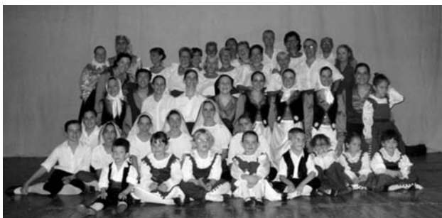
Festa de final de curs: 11/6/2006

Com a fet anecdòtic, es pot mencionar el sorteig d'un pernil entre el nombrós públic, cosa que ajudarà a finançar al Cos de Dansa i al Grup de Pares el seu viatge a Tenerife per participar-hi en el Festival Nacional de Folklore de La Laguna.