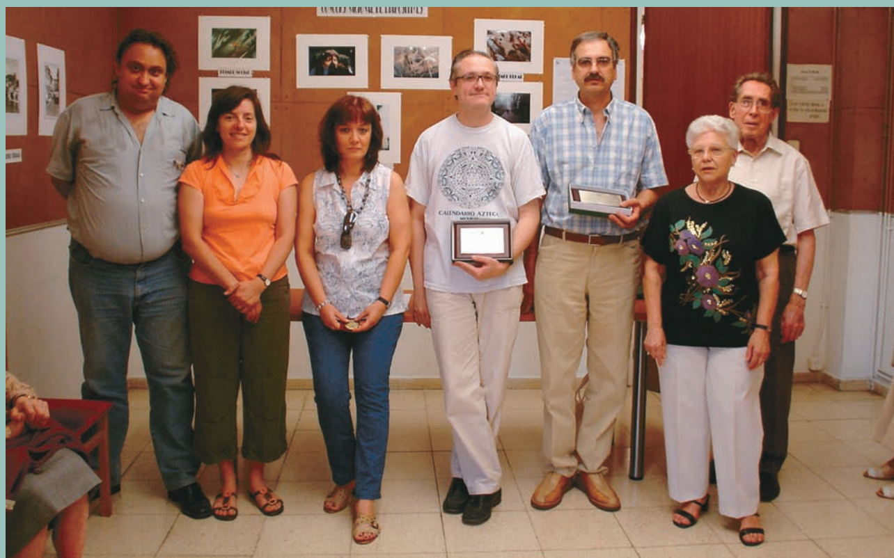
Fotogràfica. Guanyadors del concurs de diapositives.