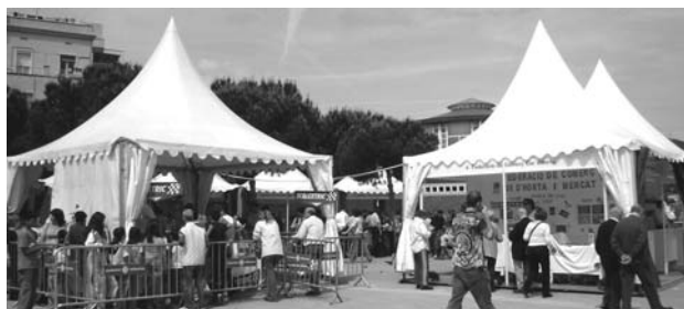
Una vista de la Mostra

Dies 12, 13 i 14, l'Ajuntament d'Horta Guinardó va tornar a organitzar la festa de la Mostra d'Entitats. Aquest any es va omplir de parades i festa el tram final de la Rambla del Carmel. L'acollida donada pels ciutadans va ser molt bona.