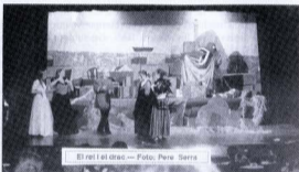
El rei i el drac

Volem dir que això no ho fem per diners, perquè la millor paga és que, quan arriba l'hora de marxar, aquestes noies ens diguin que volen continuar assajant. Gràcies, juvenils.