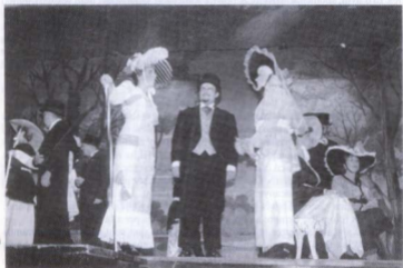
My Fair Lady.