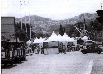
Segona Mostra d'Entitats d'Horta-Guinardó