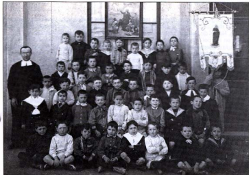
Curs 1914-15. Classe dels petits.