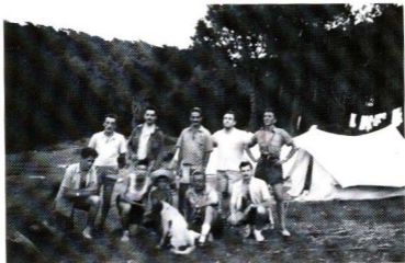
2on Campament del Centre Parroquial d'Horta Can Cervera (Montseny), del 18 al 23 de juliol de 1950