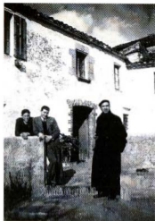
1941 – Rector del Montseny Avantguardistes d'Horta visiten el seu antic consiliari