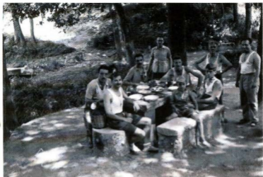
1er Campament del Centre Parroquial d'Horta Font de Sant Jordi (Vilanova de la Roca), del 3 al 7 d'agost de 1949

sopar, el Sant Rosari al voltant del foc, una mica de gatzara... i a dormir. Tots els dies i a totes hores, ens acompanyà un gos orellut que semblava un més de la colla i que quedà molt entristit quan ens veié marxar; suposem que ja li haurà passat el disgust.