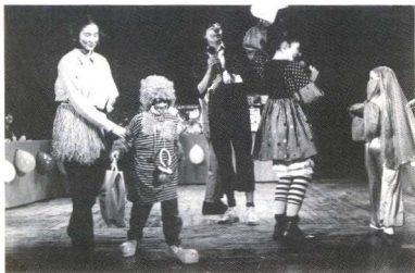
El Concurs Infantil de Carnaval 1997