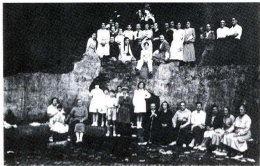
Excursió a la Font Gropa el 1931

senceres ocupaven llocs als autocars quan es feien excursions motoritzades; famílies senceres integraven les sortides que es feien a les fonts del Collserola... i era edificant, molt edificant veure pares i fills reunits a la Parròquia. Nois i noies es coneixien, simpatitzaven, s'enamoraven, es casaven, i les famílies emparentaven unes amb altres, i amb altres, i amb altres. I així anava prenent cos una gran família, una família de famílies que tenia la casa comuna a Feliu i Codina, 7 i 9.