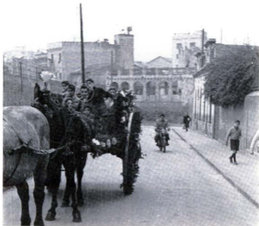
Horta. «Els Tres Tombs» de 1953