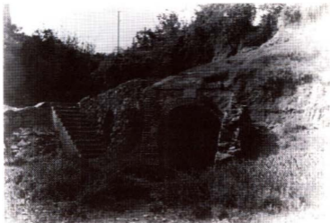
Porta de la mina anomenada Font d'en Marcelino.