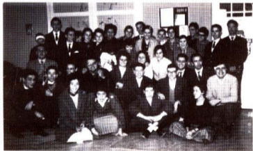
8 desembre 1960. Secció Agora. Després d'una gimcana

(*) Vegeu l'article « Rifles of Corruption », publicat, en dues parts, al núm. 32, de juny de 1992, i al núm. 33, de setembre de 1992, d'aquest BUTLLETÍ. — Nota del coordinador.