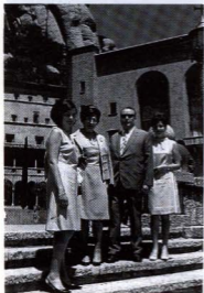
Celebrant de noces d'argent, amb la família, a Montserrat.

La teva aportació al teatre no es limità a l'escenari, sinó que fores crític teatral de l' Ideal , des del març del 53 fins al setembre del 54, data en què ho deixares perquè havies estat elegit per formar part d'una comissió econò-