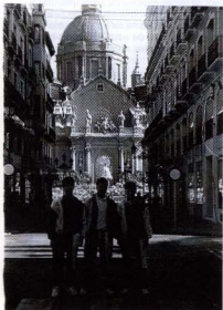
El nostre equip de 2a Nacional debuta en la categoria amb una doble victòria a Osca i Saragossa.

Hem iniciat la temporada amb 25 jugadors distribuïts en 4 equips; i uns 6 jugadors que pertanyen a l'escola de tennis taula.