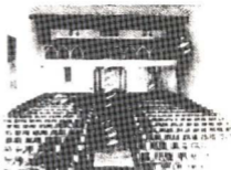
1927: Inauguració del teatre que seria cremat el 1936.

Posteriorment es modificà l'estructura de damunt del cafè, que quedà distribuïda en tres habitacions destinades: una, a secretaria; una altra, a reunions i cercles d'estudis, i una tercera, pensant en la instal·lació d'un billar. Per acabar de cobrir l'import de les obres es feu una important rifa; els premis eren una motocicleta, una bicicleta i un aparell de ràdio, premis que foren exposats als