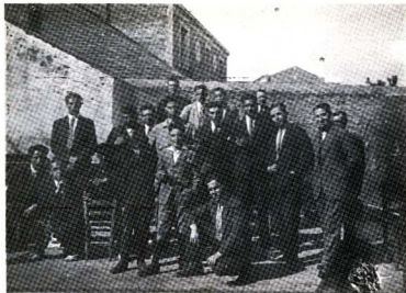
1926: Grup de socis que treballaren en les obres del 1926-27. (L'únic supervivent és el fotògraf.)

quadre escènic actuà a l'escenari del local del carrer de la Rectoria. Hi representà "Los dinamiteros", "El senyor de l'americana" i els pastorets castellans.